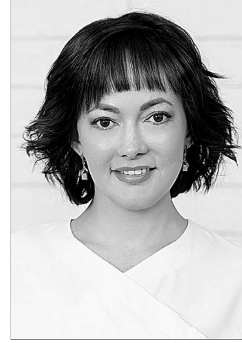
- У Вас, видимо, есть какие-то идеи и даже наброски?

Но в клинической генетике есть много нового: те заболевания, которые мы не умели лечить еще 10 лет назад, сегодня поддаются эффективной терапии. Дети, которым не суждено было самостоятельно даже сесть, благодаря достижениям генетики и разработке современ-